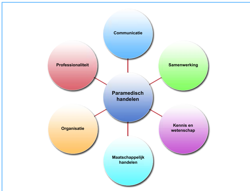
Figuur 2. Paramedische Competenties

In 2011 hebben de binnen het Kwaliteitsregister Paramedici participerende beroepsverenigingen besloten om de overstijgende paramedische competenties te beschrijven volgens de universele methode van de Canadian Medical Education Directions for Specialists (CanMEDS). De CanMEDs competentiegebieden zijn onlosmakelijk met elkaar verbonden; de kern van de beroepsuitoefening is voor de paramedicus het paramedisch handelen. Alle andere competentiegebieden krijgen er richting door (figuur 2). Het model wordt gehanteerd binnen bij- en nascholingen en ziet toe op verdieping en verbreding van de hedendaagse zorgverleners. Door binnen de kwaliteitscriteria competenties te gebruiken kan het beroepsinhoudelijk handelen inzichtelijk worden gemaakt en getoetst. Via www.kwaliteitsregisterparamedici.nl is een toelichting op de competenties terug te vinden.