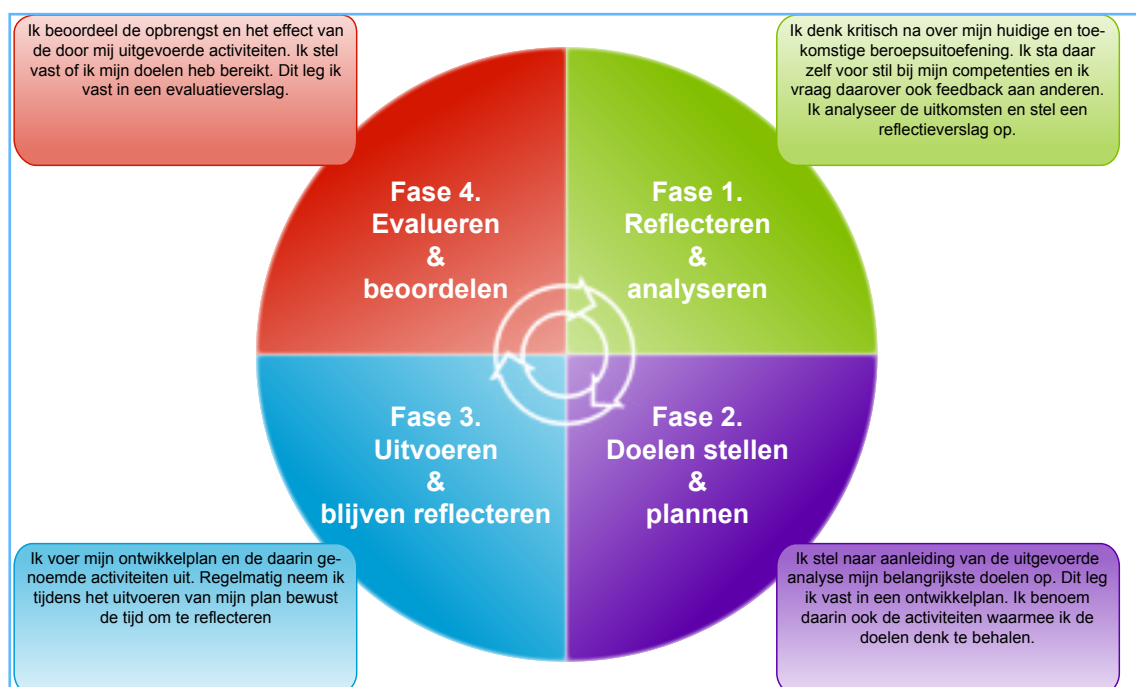
Figuur 1. Cyclus Individuele Professionele Ontwikkeling (IPO)

Professionele ontwikkeling door het voortdurend verbeteren van kennis en vaardigheden, is essentieel voor het behouden van een hoog niveau van vakbekwaamheid. Het cyclische proces valt onder te verdelen in vier fasen: 1) Reflecteren en analyseren, 2) Doelen stellen en plannen, 3) Uitvoeren en blijven reflecteren en 4) Evalueren en beoordelen. In de kwaliteitscriteria wordt dit proces Individuele Professionele Ontwikkeling (IPO) genoemd (figuur 1).